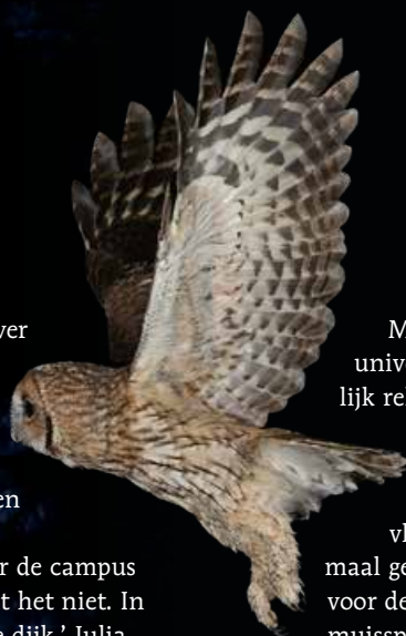
Ook bosuilen zijn op de campus gesignaleerd.

zou best kunnen dat er wel eens reeën over de campus lopen – zij leven in ieder geval in de buurt – maar die zijn nooit gezien.’ Er zijn ook egelhotels op de campus. Of die gebruikt worden is niet duidelijk. ‘Daar hebben we nooit een camera op gezet.’