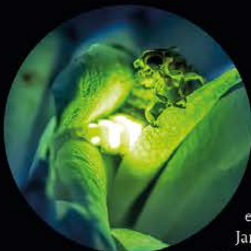
Een heel bijzondere bewoner van de Hortus: de grote glimworm.