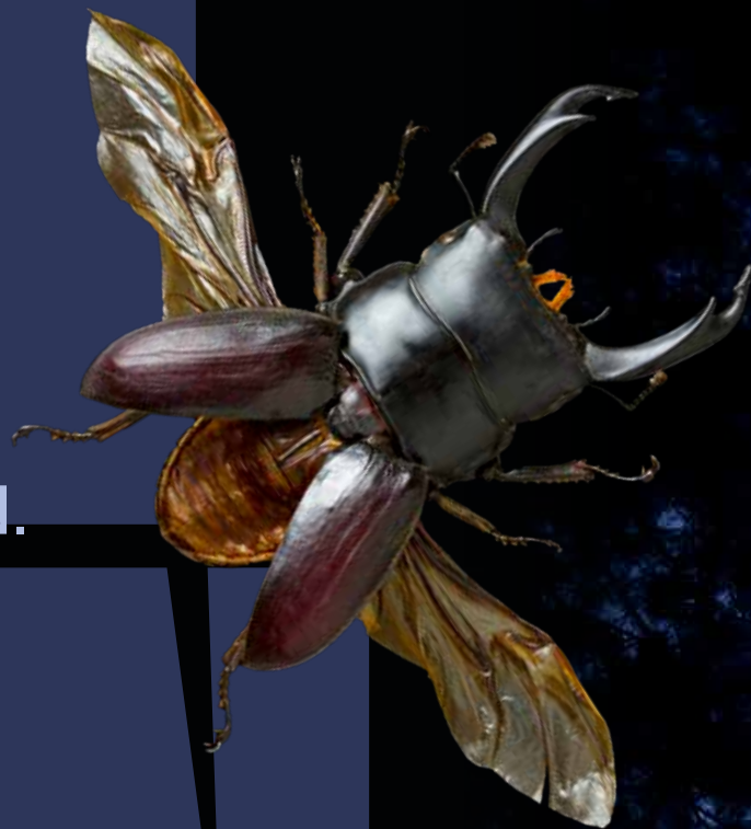
Het vliegend hert is het grootste insect dat in de Hortus is waargenomen.

VOSSEN GEEN WOLVEN, WEL VOSSEN. EN EEN VLEGEND HERT.