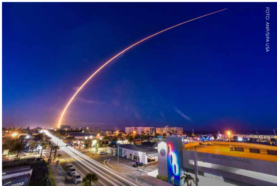
Lancering van een SpaceX Falcon 9-raket bij het Cape Canaveral Space Force Station (Florida). De raket draagt Starlink-satellieten.

Maar de Amerikanen en andere grootmachten willen op termijn een basis op de maan neerzetten, om onze kosmische buurman te onderzoeken en als tussenhalte op weg naar Mars. Dan is het gedaan met de radiostilte. Zo'n basis heeft allerlei elektronica nodig, maar ook communicatiesatellieten. Nokia heeft nu al plannen voor een 4G-netwerk op de maan.